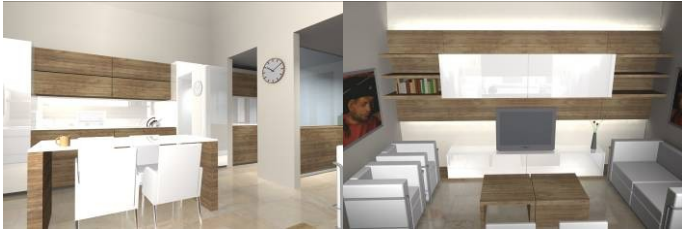
Anno e Titolo 2009 - Progettazione di interni appartamento privato (cantiere aperto)